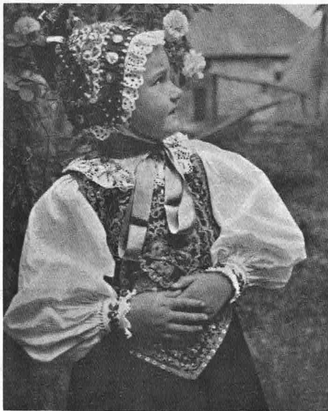
KIND AUS JAAD BEI BISTRITZ