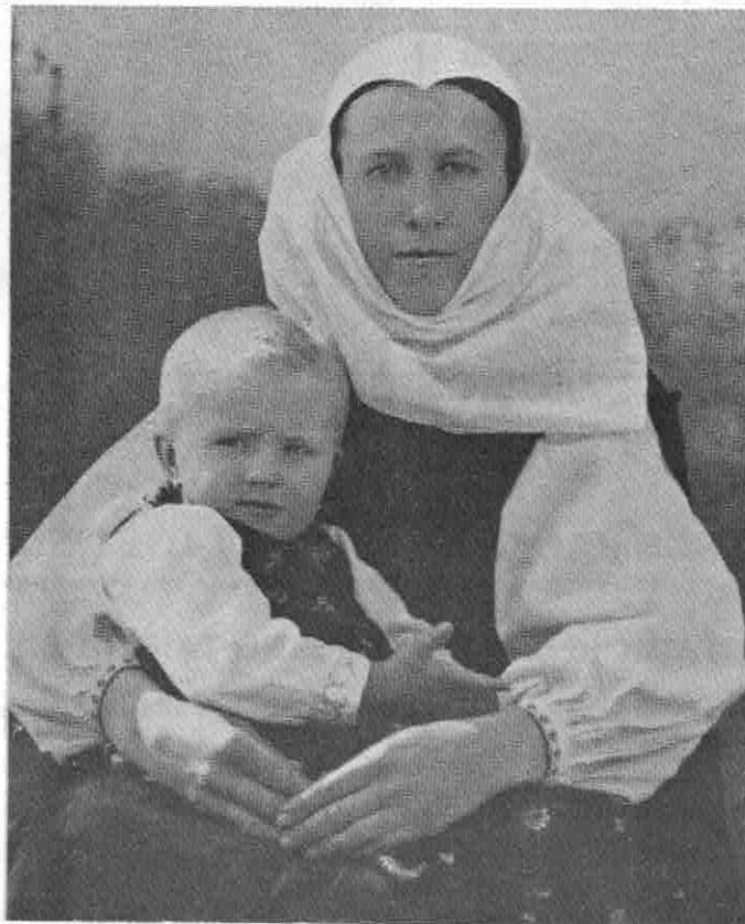
MUTTER UND KIND