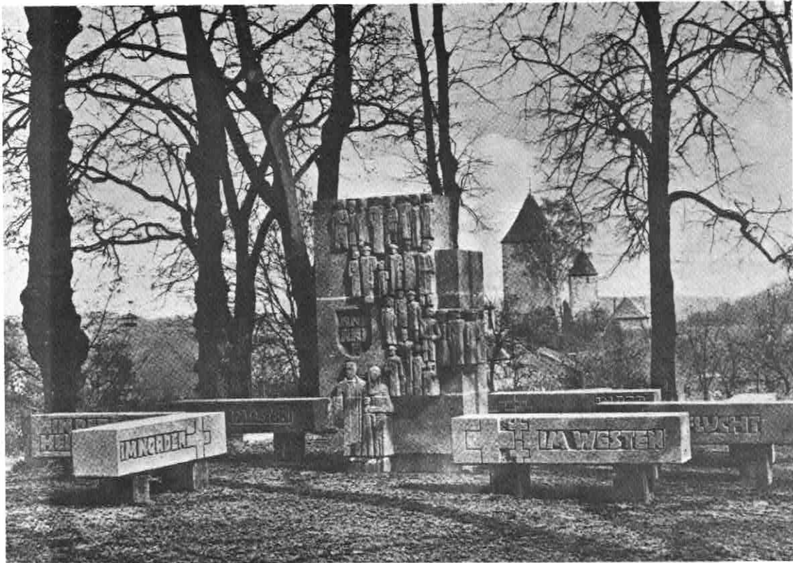
GEDENKSTÄTTE ALLER SIEBENBÜRGER SACHSEN