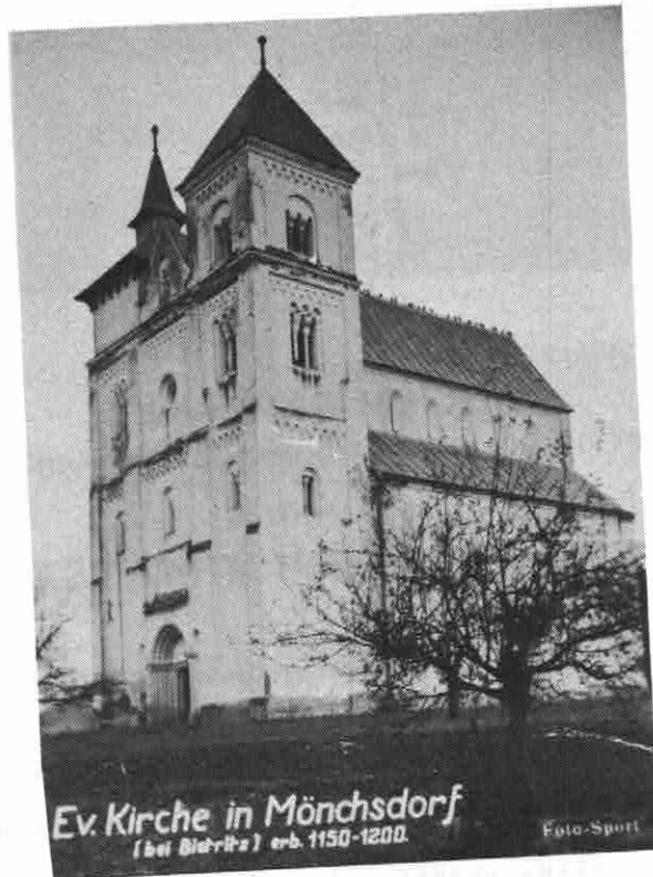
Ev. Kirche in Mönchs Dorf (bei Dietrich) erb. 1150-1200.