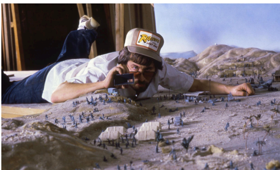
Steven Spielberg no set de 'Indiana Jones e os Caçadores da Arca Perdida'

No Cult, vai ao ar um especial que celebra os 78 anos do cineasta e exhibe 'Indiana Jones e os Caçadores da Arca Perdida' e 'Tubarão'