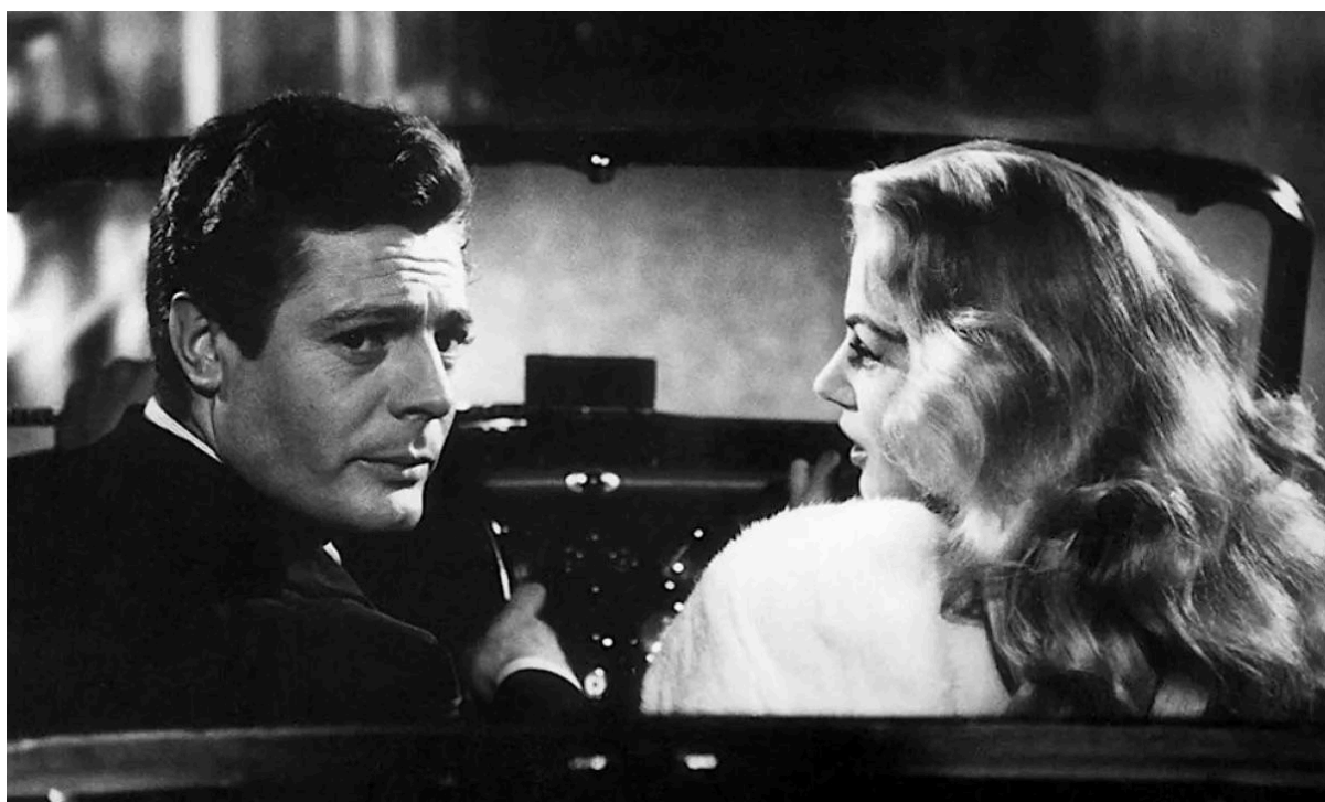
Marcello Mastroianni e Anita Ekberg em 'A Doce Vida'

No Cult, programação especial será exibida na quinta (dia 19) e traz os longas 'A Doce Vida' e '8 1/2'